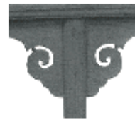
图 3 如意云纹牙头