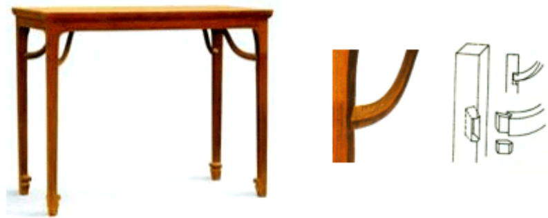
图7 霸王枱条桌的钩挂榫

钩挂榫在战国时期已经用于棺木的制造,宋朝时霸王枱出现,(霸王枱是将桌面和腿足连接起来的构件),钩挂榫就被用来连接霸王枱和腿足。钩挂榫的榫头里宽外窄、装后用木块塞紧,即将榫头固定住了,在拆卸时,可将木块取出,枱子自然会落下,榫头回到原来的入口处,即可拔出。