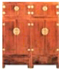
图 2 木材与铜配件的对比装饰

以明式家具为代表的中国传统家具，装饰严谨合理，讲究形式与功能的统一。特别是由构件直接显示的有力形式和实用的功能性成为装饰的一种基本范式。一方面，构件的装饰与构件本身融为一体，构件本身的考究造型已经成为一种装饰，比较典型的有家具腿足的开光、椅子的搭脑、牙板、罗锅枱、霸王枱、托泥等构件的装饰；另一方面，在家具的节点部位将结构件进行装饰，使其同时具有加固结构和装饰的双重作用，如牙头、挂牙、卡子花、矮老、券口、圈口、挡板等都是装饰性的结构件。