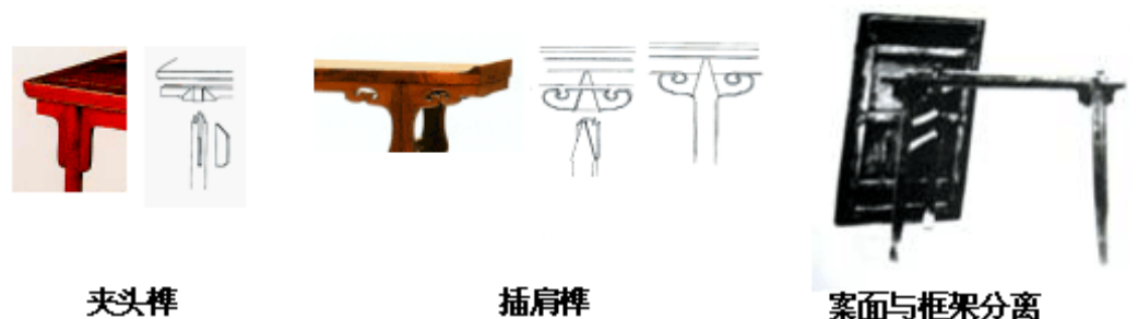
图8 夹头榫与插肩榫

夹头榫和插肩榫都是用来连接案形家具腿足与面板的结构方式,在需要维修时,可方便的将案面与腿足框架分离。