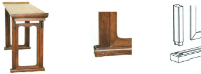
图9 腿足与托泥的接合

中华民族历来都主张节俭的生活，榫卯结构的拆卸性与这种传统美德有相同的宗旨，使损坏了的家具可以方便的修理，或者将拆下的部件作其它的用途。传统家具能供几代人使用，甚至沿用至今，可拆装的榫卯结构是关键的原因。榫卯结构的制作工艺高超，家具不到不得已坚决不用钉和胶，从生态设计的角度来看，这也是减少了同一产品上材料的种类，是有利于回收处理的。