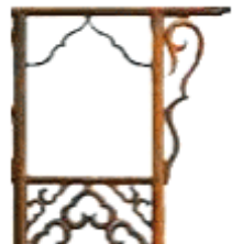
图 4 卷草纹挂牙

简洁、严谨的结构和适当的装饰蕴含着朴实、纯真的民族性格和追求率直、典雅、精制的艺术精神。这与现代设计“少就是多”的理念，和倡导生态设计的“极简主义”的宗旨是一致的。