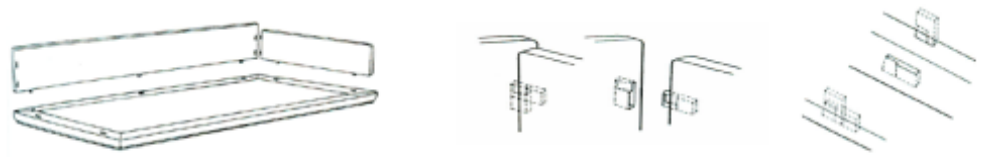
图6 罗汉床上使用的走马销

传统家具中经常使用的“走马销”(南方匠师又称“扎榫”)是一种特制的栽榫,榫头上端小,下端大,卯眼的开口半边大,半边小,安装时,榫头由卯眼开口大的半边插入,推向开口小的半边,这样就扣紧了;如要拆卸,只需将构件退到卯眼开口大的一端即可拔出,把两构件分开。它一般用在可装可拆的两构件之间,例如翘头案的活翘头与抹头的结合,罗汉床围子与床身抹边的结合,屏风式罗汉床围子扇与扇之间的结合。