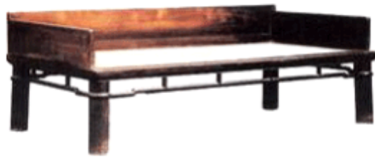
图1 紫檀独板围子罗汉床

传统家具的整体结构从最早的箱式结构不断向框架式结构转化，在转化的过程中不断简化，直至达到没有一个多余的构件的程度，可以说已经简化到了极致。王世襄先生在《明式家具的“品”与“病”》一文中，将明式家具的精妙总结为“16品”即十六个方面，其中第一品就是“简洁”。并列举了相应的实例—紫檀独板围子罗汉床(图1)。这张床用三块没有任何装饰的板材做围子，用粗大的圆材制成的四条腿足直接落地，结构和装饰都十分严谨和简练。每一结构都有明确的、合理的功能，虽然没有多余的装饰，但同样体现了造型的优美，真正做到了简练而不简单，体现了中国传统家具“简而美”的特点。