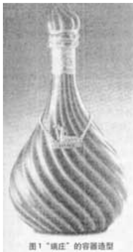
图1 “端庄”的容器造型

由于化妆品在使用时必须拿在手里，然后将内盛装物涂抹（或喷）于脸部（或身体其他部位），有时还要先在手掌中将其铺开揉匀，然后再涂于面部，在每一个步骤中，都是人和产品情感的交流过程，在这个过程中人和产品的亲和力会逐步加强或减弱，这取决于化妆品的设计（从造型、色彩、材质到内部盛装物），其中容器的造型设计会在这个过程中对人的视觉和触觉（甚至由视触觉引发的味觉联想）起到关键的影响作用。在这个过程中，化妆品担当的是一种使用者的朋友的角色，因此化妆品容器应该具有丰富的表情和动作，也因此应该具有类似于人的气质，具有内在、外在的气质美，或端庄秀美，或小巧别致，或活泼伶俐，或乖巧温顺。这样一来，和人的沟通便会更加容易。尽管这种因使用过程而产生的情感碰撞与人们欣赏雕塑的过程产生的感情有所不同，但造型语言所起到的情感激发作用却是具有很多共性的，因为使用过程中人对化妆品产生的这种亲切感、朋友感与人们把雕塑当成具有生命特征的朋友的道理是一样的，因此，造型语言的运用是相通的。雕塑是用来欣赏的，欣赏的过程可以看或者触摸，这种看或者触摸也是一个“过程”，许多雕塑正是利用了这个“过程”，抓住欣赏者的欣赏步骤和每一步的心理变化，利用角度变换、体量对比等手法塑造出舒缓、急促、细腻、粗犷、柔软、坚硬等容易引起人感情触动的形体。正是在欣赏的“过程”中，欣赏者对雕塑有了一种认识，每一个细节的变化带给他们的反映都具有一种表情和气质，形成一定的“性格”特征。