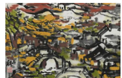
千岩竞秀——陆秀竞中国画作品展...