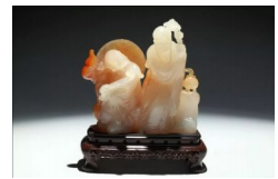
2018·中国当代工艺美术双年展