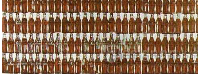
图5 《二百一十一个可口可乐瓶》