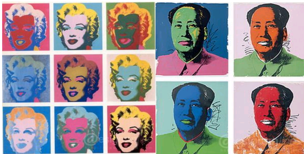
图6 《玛丽莲·梦露》 图7 《毛泽东》

沃霍尔通常选择已经被大众传播媒介定型、被公众普遍接受了偶像或者政治人物作为肖像作品的创作题材，并且绝大部分的题材并不是根据自己对对象的观察、了解、认识的基础上创作的，而是依据报刊、电影剧照或者招贴画等大众媒介上的图片完成的。在肖像题材代表作图6《玛丽莲·梦露》和图7《毛泽东》中，由于沿用了丝网印刷的技术，作品中笔触完全消失，色块虽然对比强烈，但是经过精心的色调分离后完全略化了色彩之间的微妙变化，复杂的色彩通过高度的概括、取舍、归纳而变得简练，体现出他用色用形的果断。沃霍尔完全避免个人情感和传统艺术对于作品所传达信息的依赖，只是利用传媒重复传媒，神秘模糊的表象和符号被冷静、理性地呈现出来，一种毫无深度感和异乎寻常的平面化构成了沃霍尔作品的基本形式特征，传统西方绘画形式语言在他的作品中几乎完全失去了作用。这种独特的简化分离的表现形式和改变传统的创新思路，积极地引领了波普艺术的内在美学观念和意识形态内容的潮流。