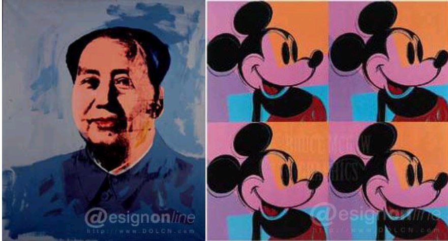
图2 《毛泽东在1972》 局部图 图3 《米老鼠》

东肖像开始广泛地与不同媒材结合产生不同形式的作品，不久中美果真建立了外交关系。图3《米老鼠》则是沃霍尔从精神消费文化中捕捉到的流行符号。他对媒介文化的关注为大众提供了一种观察传播现象的手段和方式，从实践上诠释了符号学对于传播现象及媒介文化的某些观点和论述。这种以工业方式的大批量生产、复制而成的艺术品，已不再是过去那种传统的文化形式，它是文化与经济联袂的复合体。因此以沃霍尔为代表的波普艺术折射出的消费文化，是以市场需求为导向的。它在引起大众物质欲望无限膨胀的同时，也潜在地表达了他们内心的真实需要和文化追求的失落。沃霍尔的作品直接受到了符号学派的影响，与符号学有千丝万缕的联系，他的作品也大大丰富了符号学研究的视野和领域[4]。