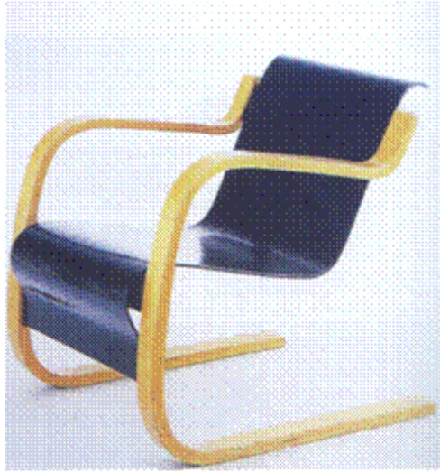
图5 阿尔托设计的扶手椅