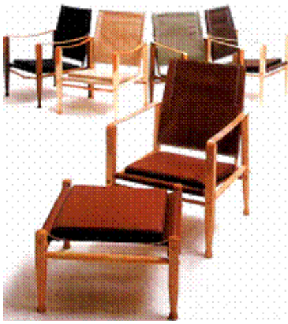
图4 克林特设计的椅子