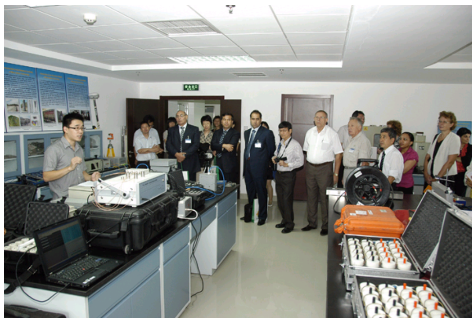
与会代表参观安科院实验室