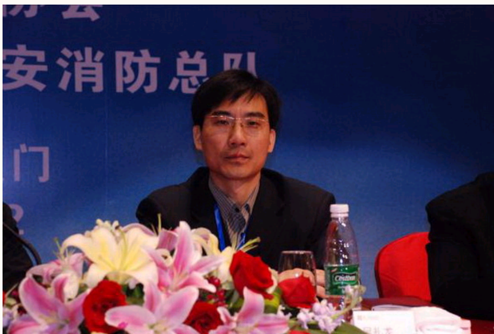
公安部消防局防火监督处副处长吴礼龙讲话

吴礼龙副处长代表公安部消防局对本次会议的隆重召开表示热烈祝贺，对与会代表表示热烈欢迎。吴礼龙副处长对火调专业委员会多年来为我国火灾调查事业的发展所做出的贡献给予了充分的肯定，一是促进了火调队伍建设，火调人才年轻化，火调委员圆满完成了火调任务；二是搭建文化平台，积极开展学术交流，促进火调事业和谐发展；三是进行专项调研，灵活运用火调成果，推动了技术创新。同时吴礼龙副处长也提出了具体的要求：一是继续创新服务方式，二是丰富火调学术内涵，三是加强委员会自身建设，提高火调地位。