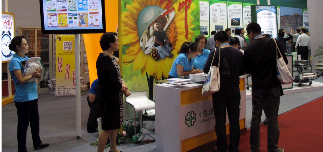
中国安科院参加第七届中国国际安全生产及职业健康展会