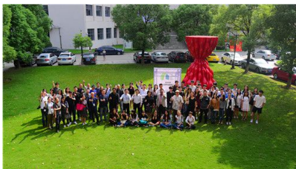
编辑：陈前 信息员：陈盟盟 撰写：刘晨澍、宋志涛