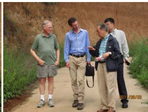
安芷生院士与Wallace S. Broecker教授等考察黄土剖面