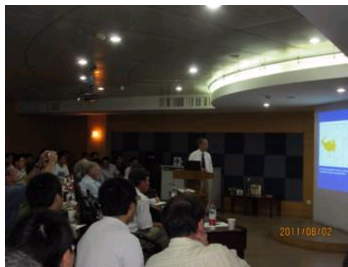
安芷生院士介绍地环所情况及最近的科研成果