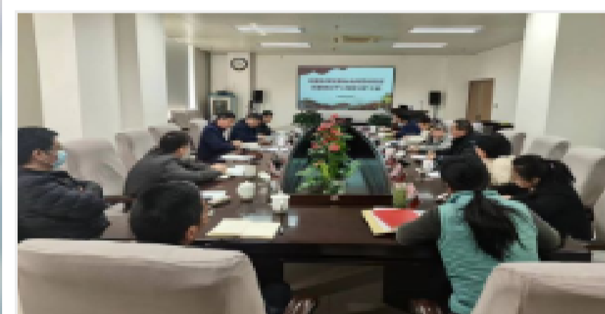
烟台海岸带所召开党委理论中心组学习扩大会议