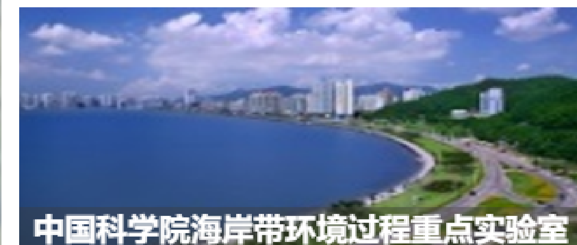
中国科学院海岸带环境过程重点实验室