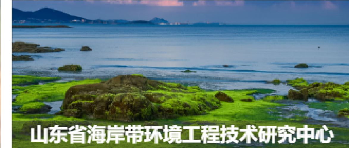
山东省海岸带环境工程技术研究中心