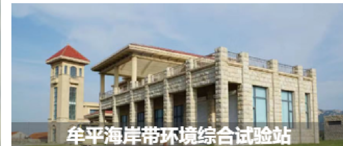
牟平海岸带环境综合试验站