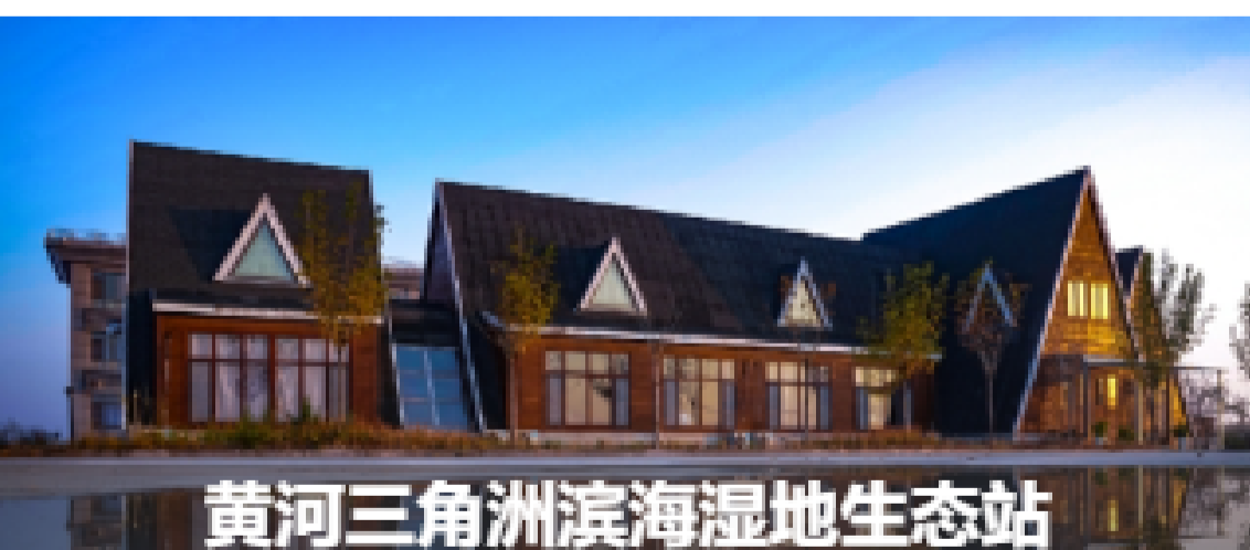
黄河三角洲滨海湿地生态站