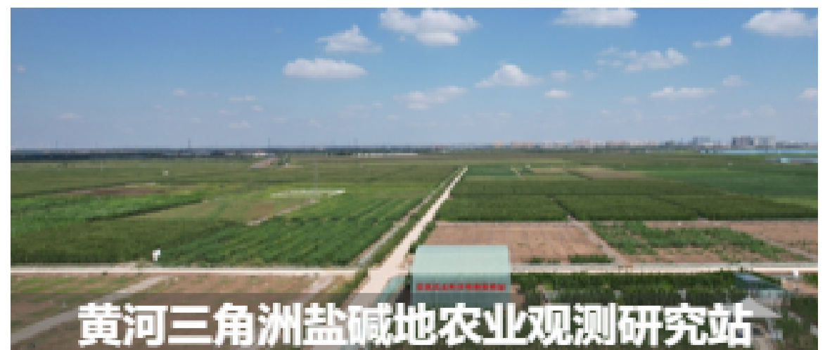
黄河三角洲盐碱地农业观测研究站