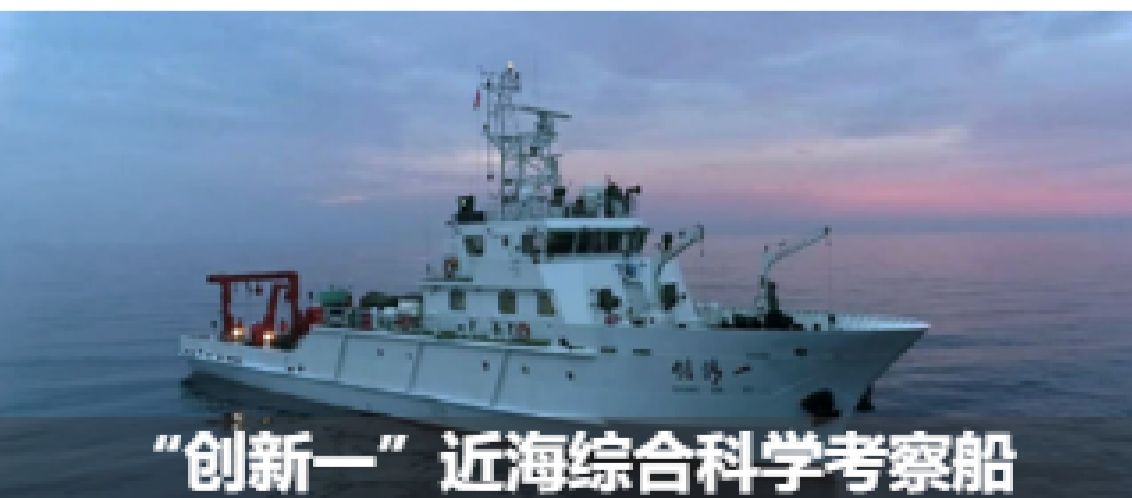
“创新一”近海综合科学考察船