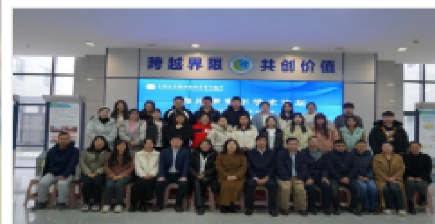
烟台海岸带所举办首届“海岸带青年学术论坛”