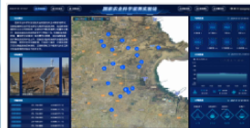
甘于坚守 勇于攀登 把论文写在祖国大地上 ——中国科学院烟台海岸带...