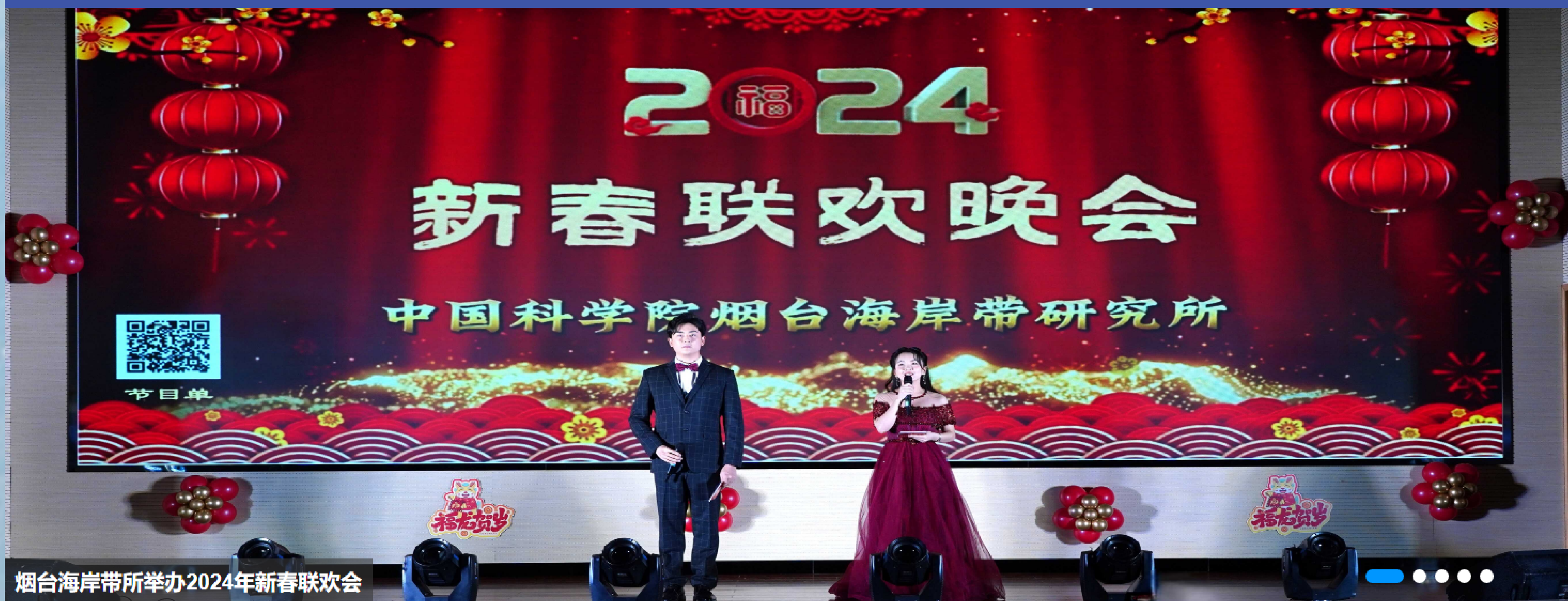
烟台海岸带所举办2024年新春联欢会