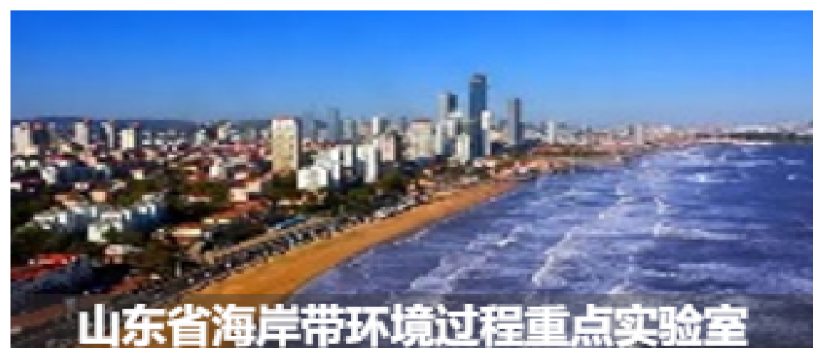
山东省海岸带环境过程重点实验室