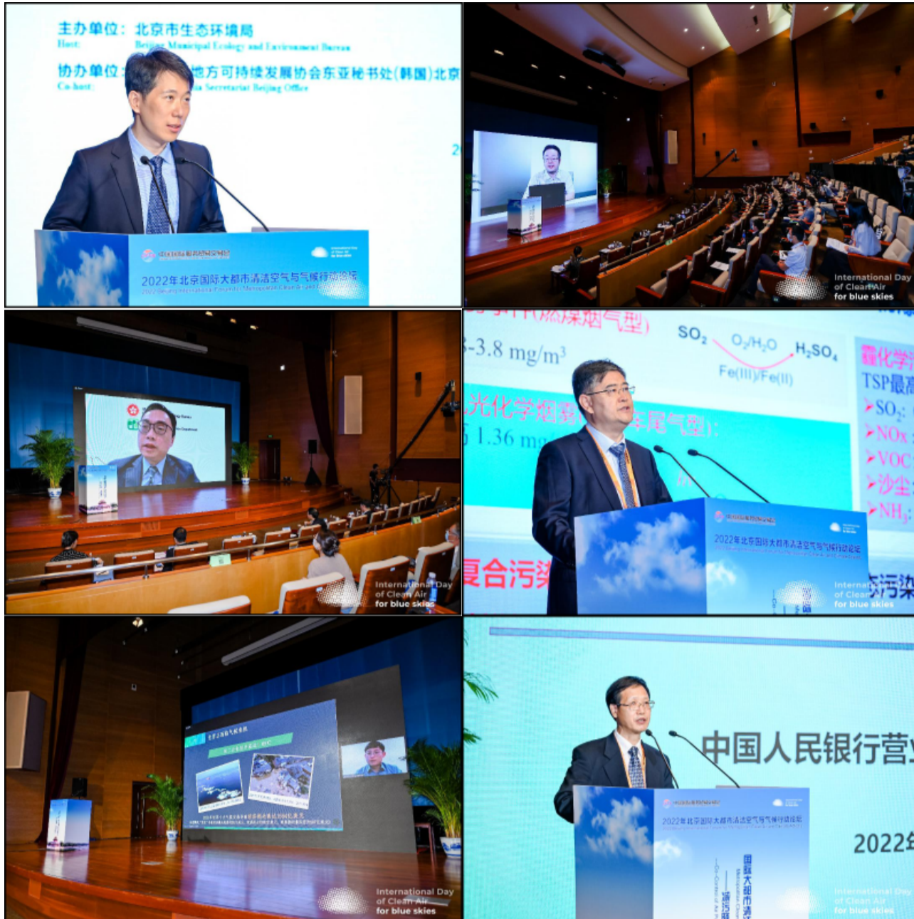
分享经验 为减污降碳协同增效贡献更多力量

5日下午，大会设置了“PM2.5和O3协同治理”和“减污降碳协同增效”两个专题环节，邀请中外专家共同探讨，出谋划策。