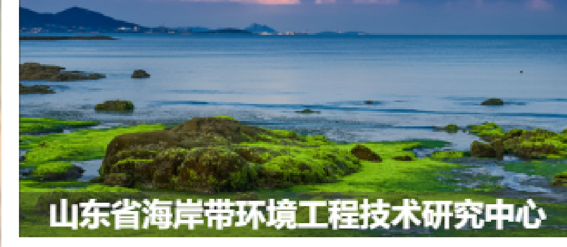
山东省海岸带环境工程技术研究中心