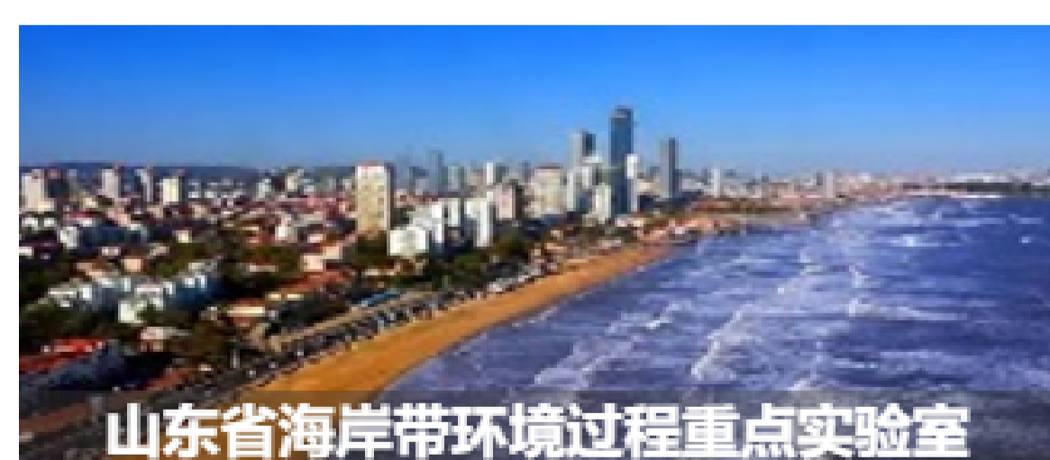
山东省海岸带环境过程重点实验室