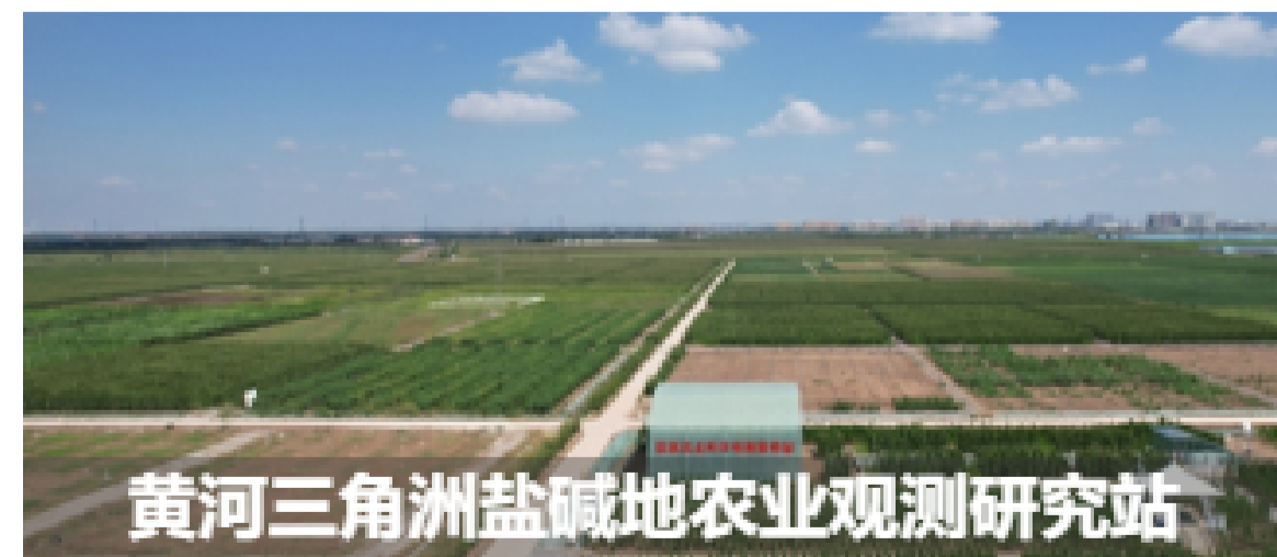
黄河三角洲盐碱地农业观测研究站