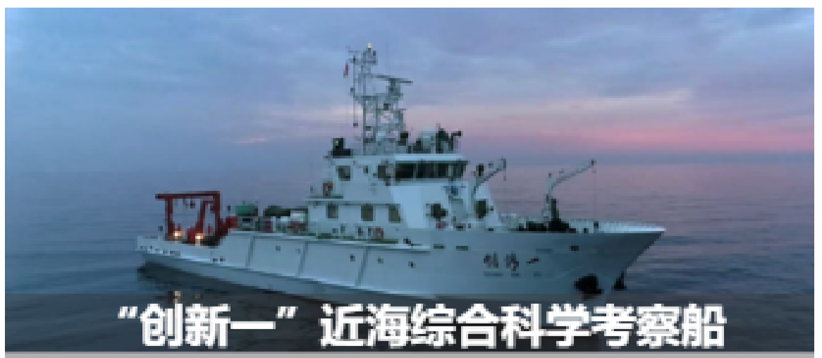
“创新一”近海综合科学考察船