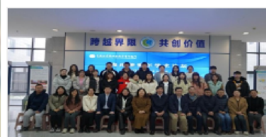
烟台海岸带所举办首届“海岸带青年学术论坛”