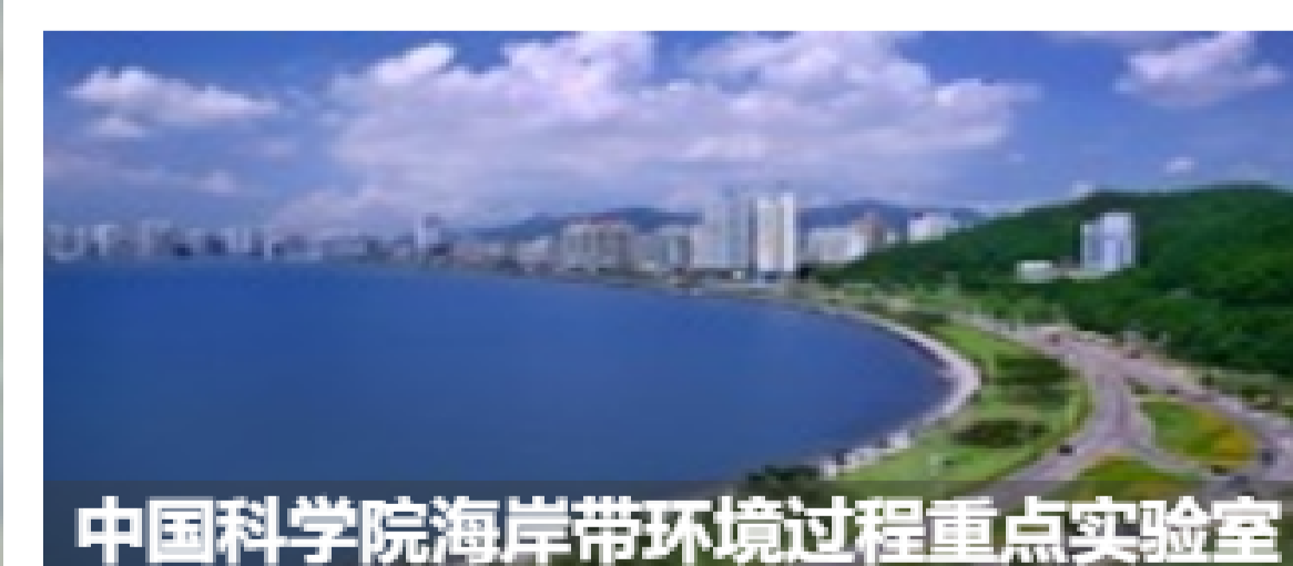
中国科学院海岸带环境过程重点实验室