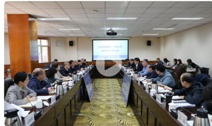
【校园快报-3】甘肃省科技厅 兰州大学召开科...