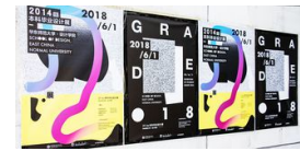
2018设计学院本科毕业设计展