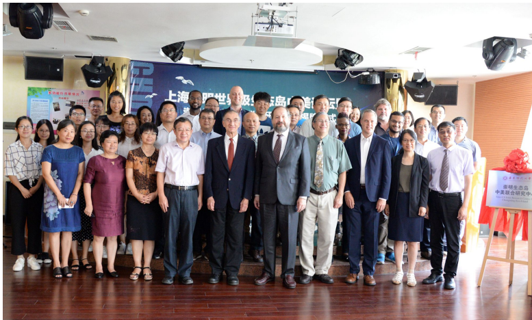
2018崇明世界级生态岛中美论坛暨“崇明生态岛中美联合研究中心”成立仪式

8月7日-8日, 我校与美国哥伦比亚大学共同举办的“2018崇明世界级生态岛中美论坛暨崇明生态岛中美联合研究中心揭牌仪式”在上海市崇明区举行。来自两所学校的30余位专家学者就崇明世界级生态岛的挑战与前景等进行了深入探讨, 并就未来的全面合作进行了规划与商谈。崇明生态岛中美联合研究中心将融合华东师大和哥伦比亚大学优势学科, 打造国际一流学术科研平台, 助力崇明世界级生态岛建设。