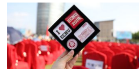
华东师范大学2018届毕业生典礼举行