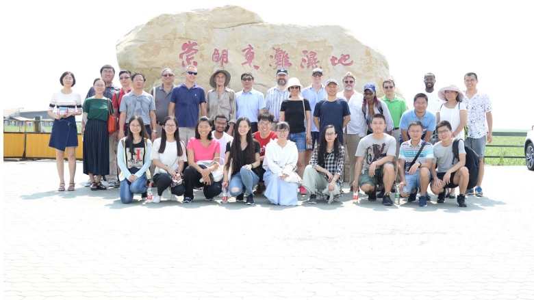
与会专家考察崇明东滩湿地