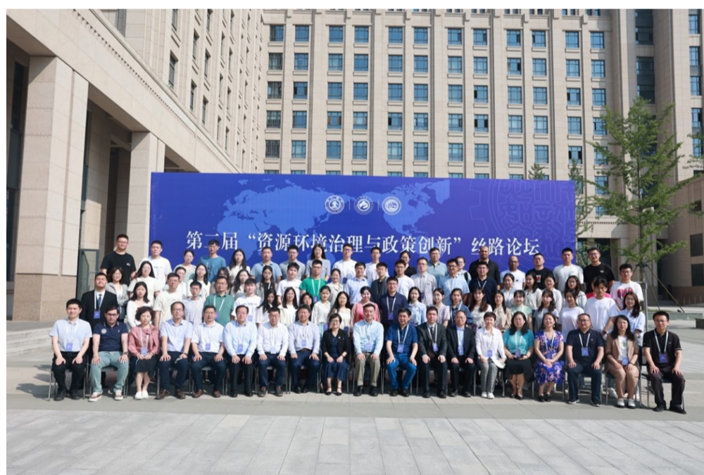
全体参会嘉宾合影

随后,本次论坛进入到主旨报告环节。本次会议共设置两个主旨报告版块,8位主旨报告嘉宾分别作报告。第一主旨报告版块由西安交通大学社会科学处处长梅红教授主持。南京大学地理与海洋科学学院教授、中国土地学会副理事长黄贤金作了题为《全国主体功能区规划(2010-2020)的资源环境效应》的报告。北京大学城市与环境学院院长聘教授、中国自然资源学会资源流动与管理研究专业委员会副主任刘刚作了题为《社会经济代谢与资源环境管理》的报告。北京师范大学经济与资源管理研究院副院长、中国生态经济学学会理事林永生教授作了题为《中国环境保护税政策与外资企业区位选择》的报告。西安交通大学公