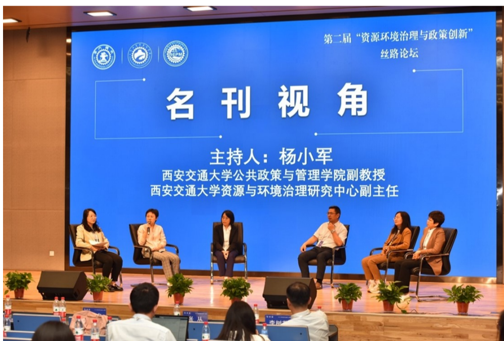
名刊视角圆桌会议

本届论坛以“高质量发展背景下的资源环境治理与政策创新”为主题，以我国改革开放四十多年来的发展成就为背景，针对我国在发展中存在的土地、资源和生态环境治理中的主要问题，与会专家展开了精彩的思想交流与碰撞，为高质量发展背景下的资源环境治理提供新的思路和研究视角。