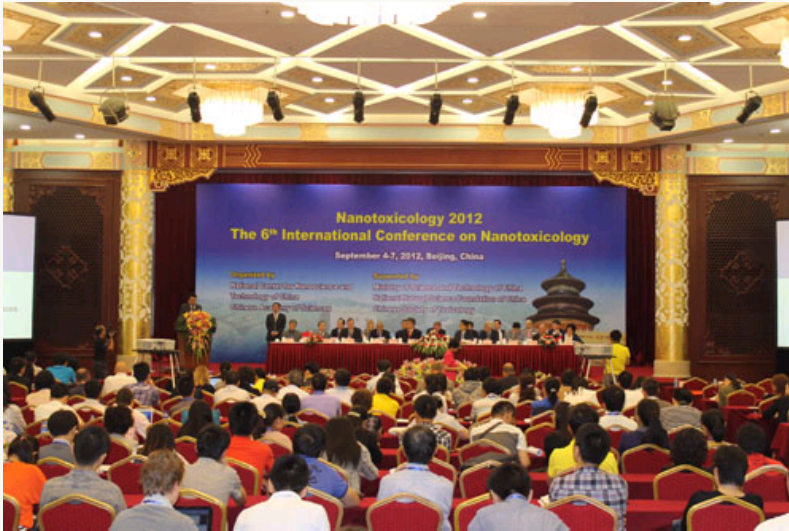
第六届纳米毒理学国际大会现场