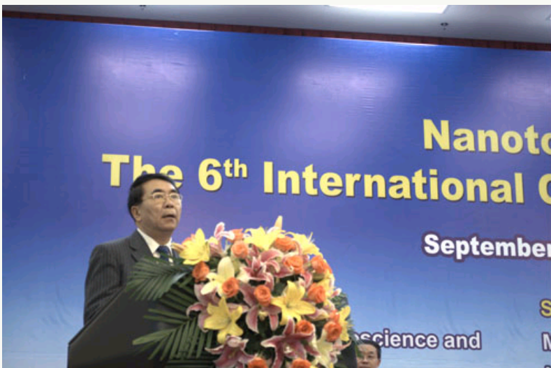
中国科学院院长白春礼致辞

【科学网 张笑报道】由中国科学院、科技部、国家自然科学基金委员会、中国毒理学会共同主办，国家纳米科学中心承办的“第六届纳米毒理学国际大会”（Nanotoxicology—2012）今天（9月5日）隆重召开，本次大会是继2007年意大利威尼斯、2008年瑞士苏黎世、以及2010年英国爱丁堡之后首次在亚洲召开的纳米毒理学领域的又一次国际盛会。