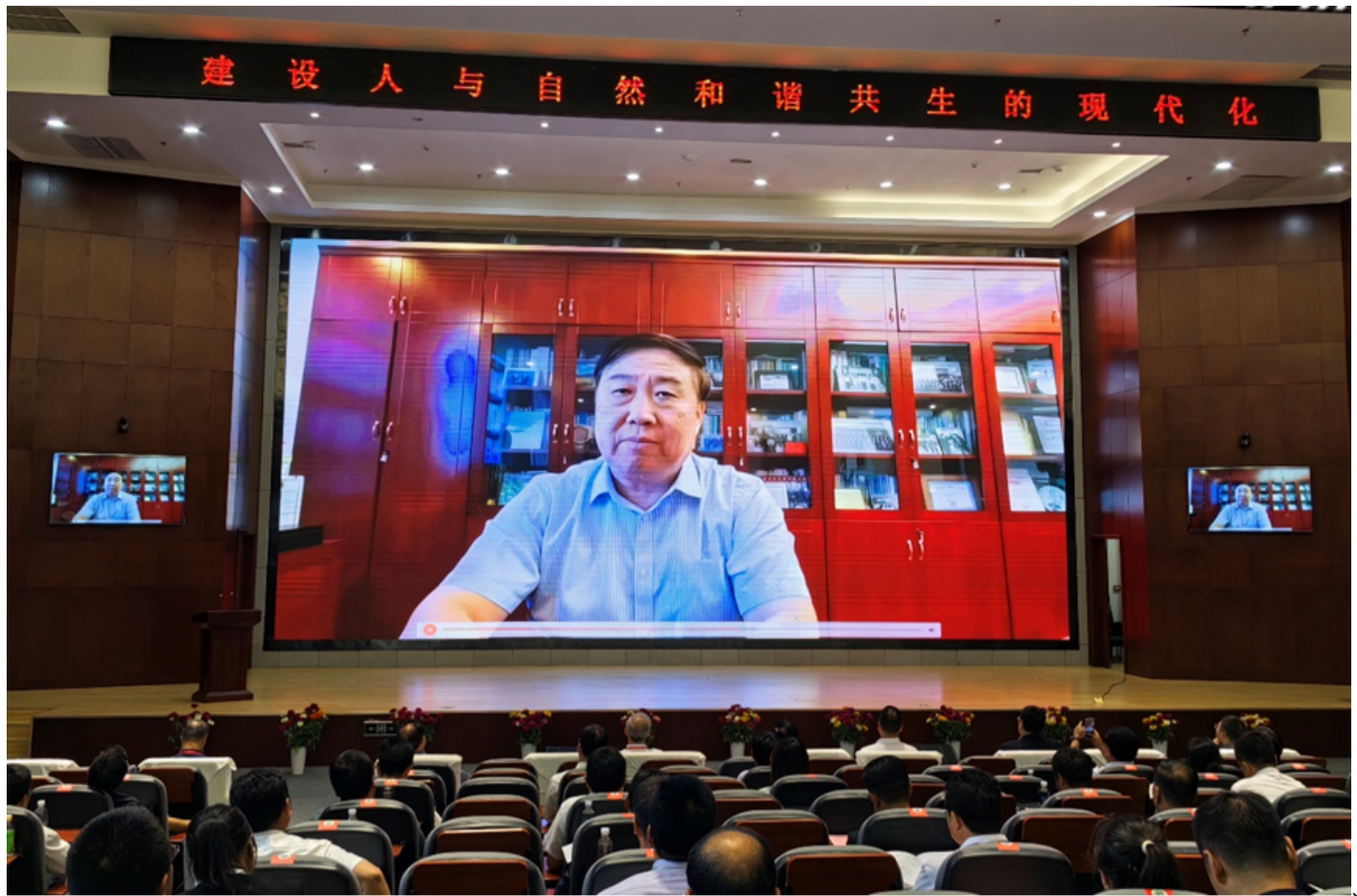
傅伯杰院士做主旨报告