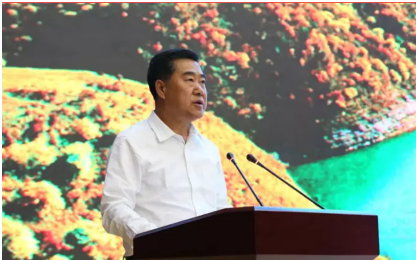
甘南州委书记何谋保致欢迎辞