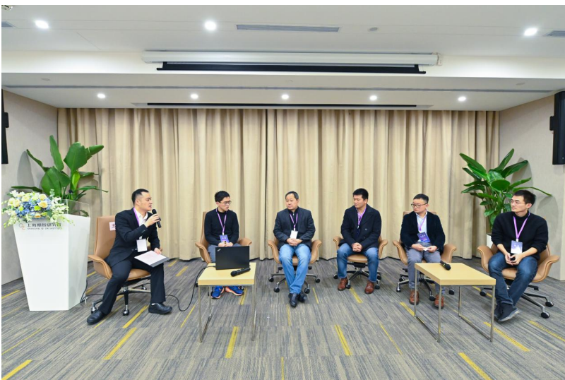
“大数据、人工智能与环境政策评估”圆桌论坛