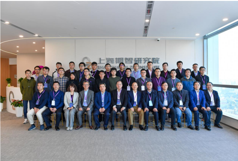
参加论坛的嘉宾师生合影

圆桌论坛结束后，张希良和姚期智分别作了总结点评。两位嘉宾对本次讨论的重要性表示充分肯定，包括来自清华大学、复旦大学、上海交通大学、上海市科委、上海环境能源交易所、国家应对气候变化战略研究和国际合作中心的50余位嘉宾、师生共同见证此次论坛圆满举办。