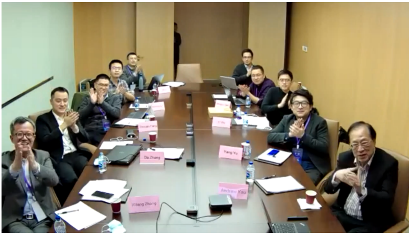
在座嘉宾与国外专家线上交流