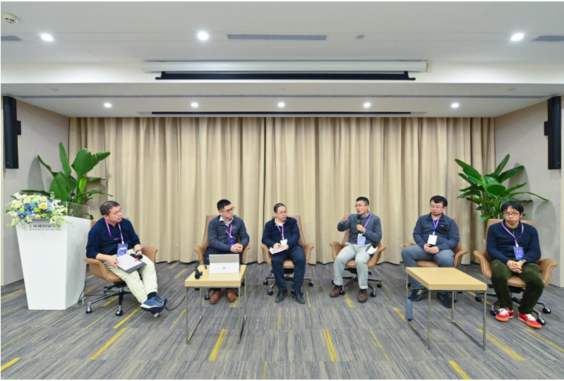
“气候变化谈判与博弈中的信息技术”圆桌论坛

报告结束后，相关领域嘉宾分别参与了三场圆桌论坛。三场圆桌论坛分别就“大数据与气候变化治理”“大数据、人工智能与环境政策评估”以及“气候变化谈判与博弈中的信息技术”主题展开了讨论。来自清华大学、复旦大学、上海交通大学、上海环境能源交易所、昆山杜克大学和厦门大学的数十位专家和学者参与了讨论。