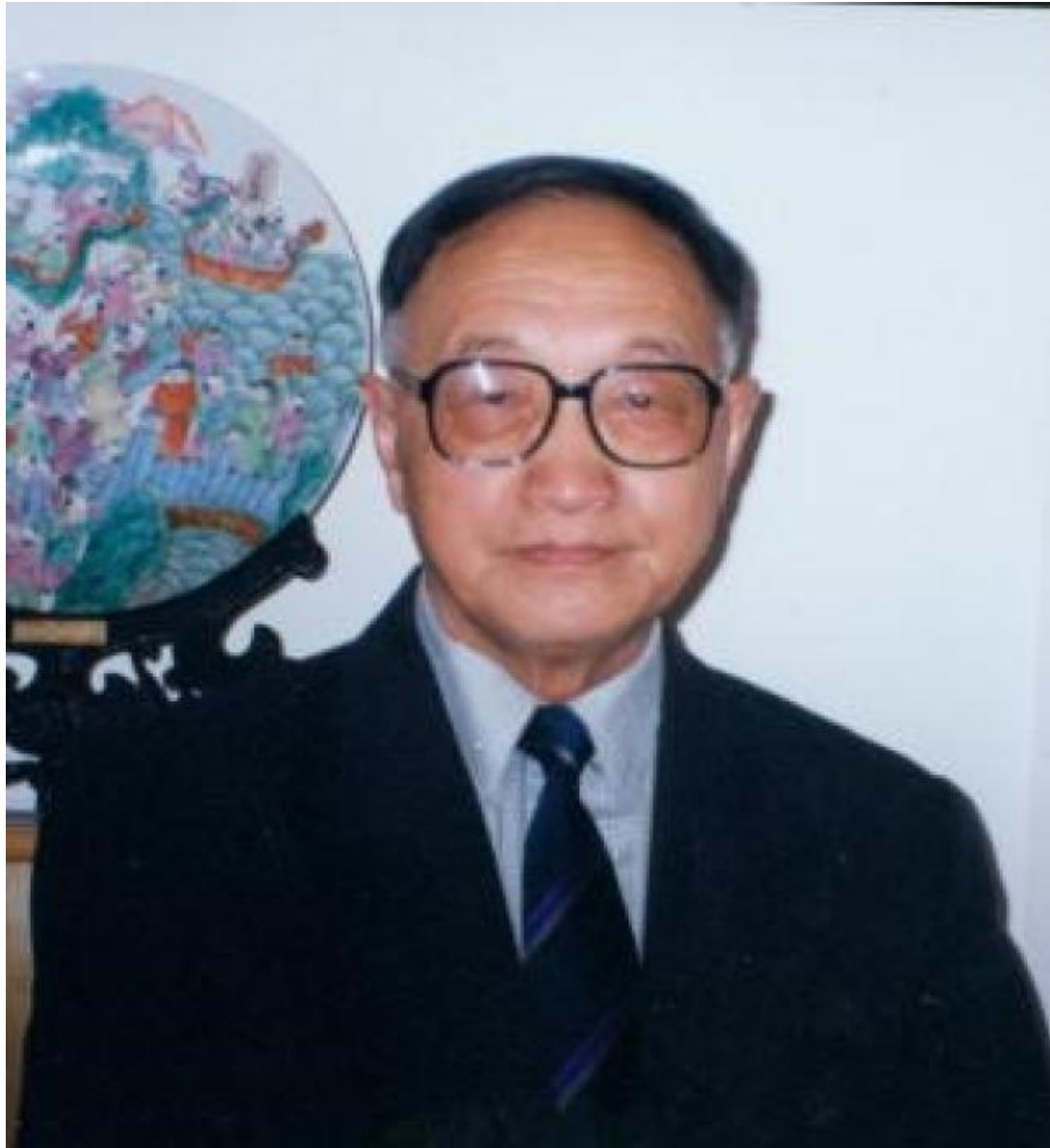
王恩涌，北京大学城市与环境学院教授，我国著名的地理学家、文化地理学家和地理教育家。原从事植物地理的教学，后转向文化地理，开设文化地理与政治地理课，介绍西方的人文地理思想，推动了我国人文地理教育新发展。所写的《文化地理学导论》