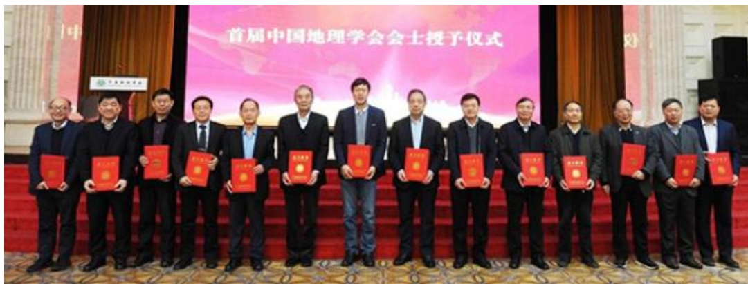
会议现场部分会士合影