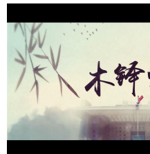
北京师范大学宣传片2019

期刊网址： http://www.keaipublishing.com/en/journals/international-journal-of-geoheritage-and-parks/