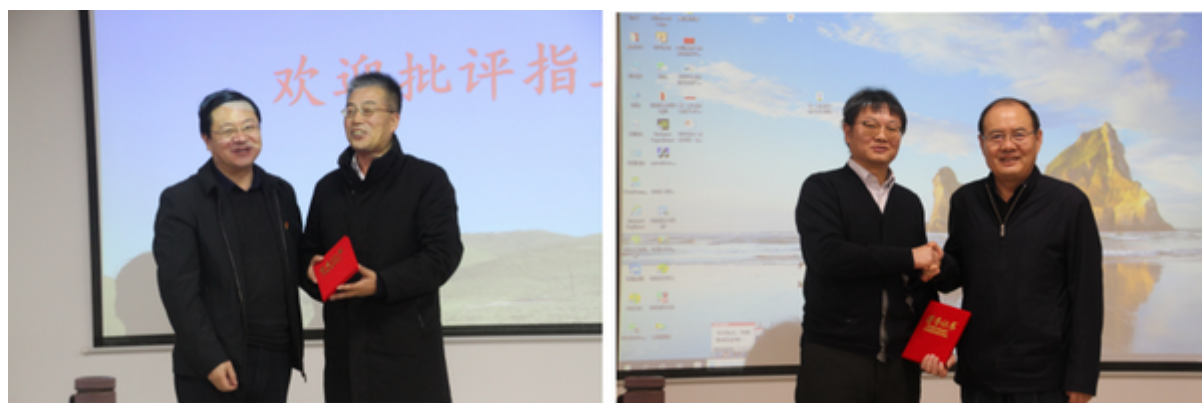
向特邀报告颁发证书