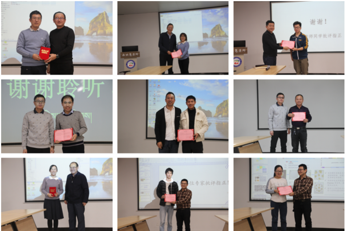
向青年科学家报告者颁发证书