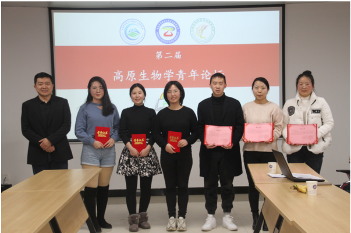
向优秀研究生报告颁发证书