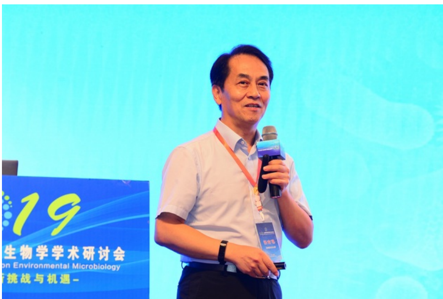
任南琪院士作特邀大会报告