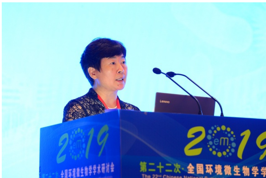
黑龙江省科技厅副厅长韩金华致辞