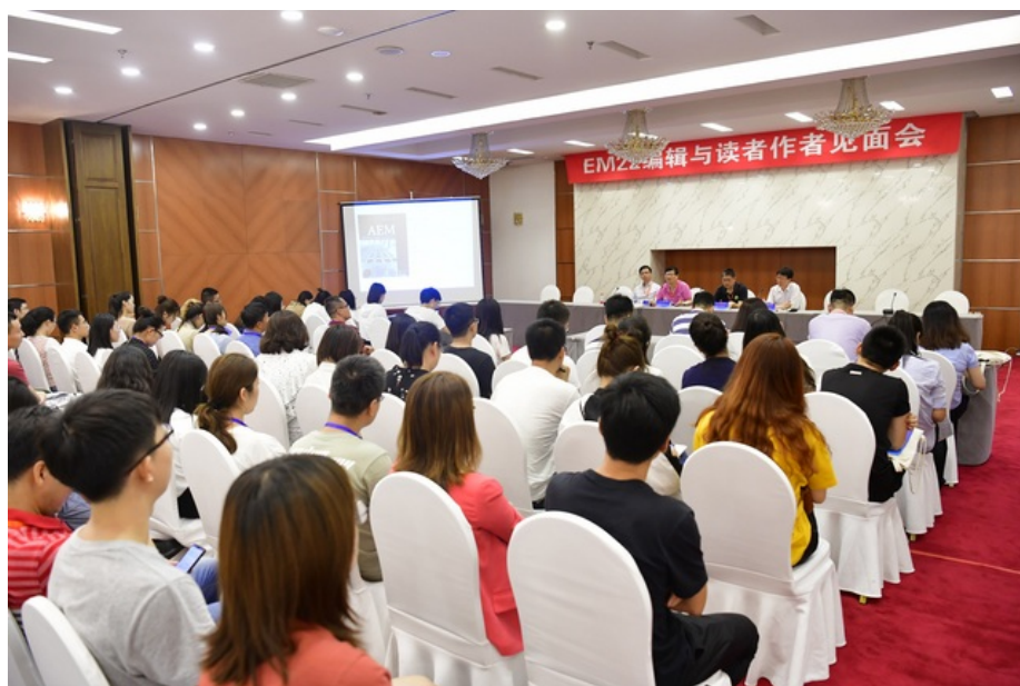
编辑与读者作者见面会