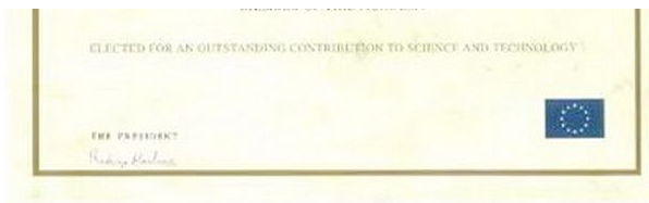
赵进才院士欧洲科学院外籍院士证书