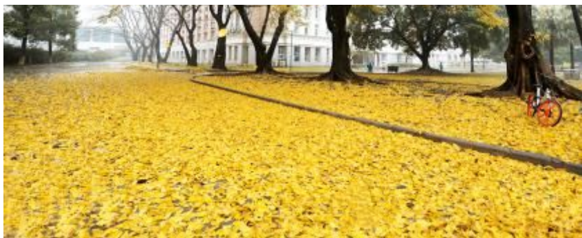
一夜春雨遍地金黄，最美华师惊艳了广州城！