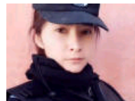
新疆美女民警走红