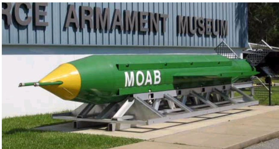
美国研制的炸弹之母（MOAB）巨型炸弹