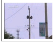
农村安保谁关注 高音喇叭构建天网保平安