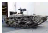
陆战武器 美国“粗齿锯”无人车