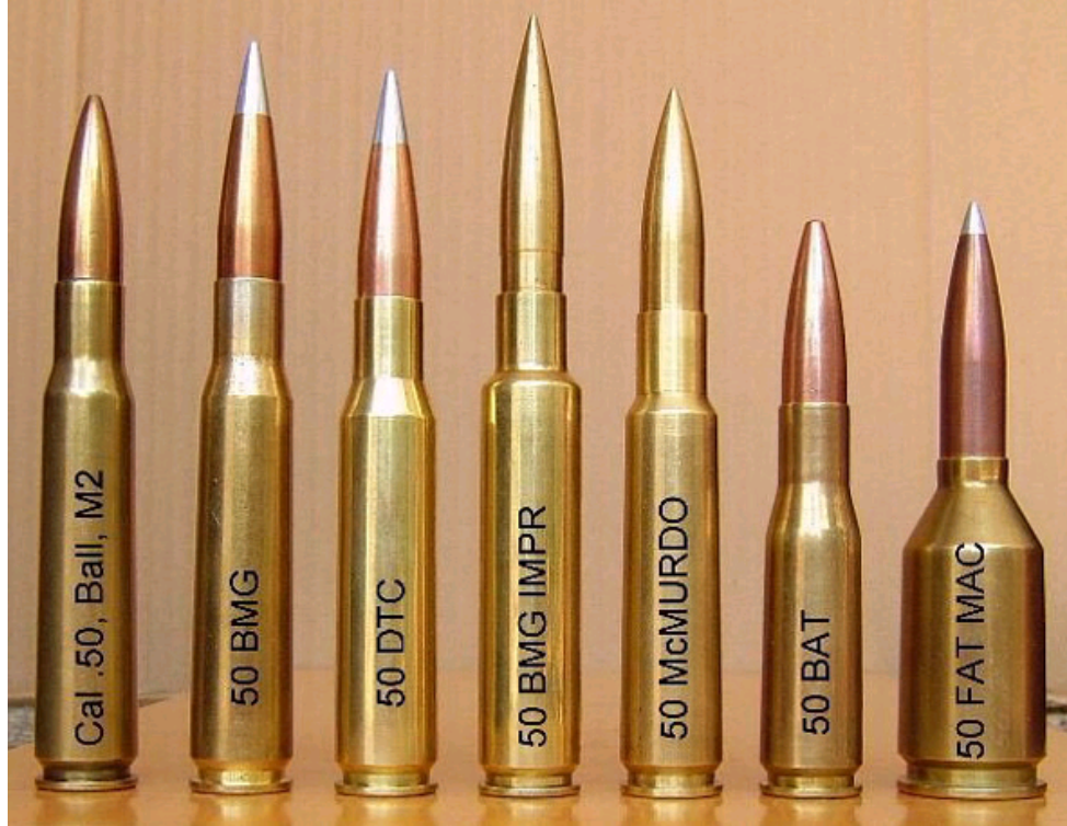
M2式重机枪配用的弹药[千龙军事]

勃朗宁M2HB 12.7毫米重机枪产生于第一次世界大战期间，1933年经改进后再也没有大动过。历经两次世界大战，至今已是风雨沧桑80多载的机枪，成了当之无愧的武器中的“老寿星”。