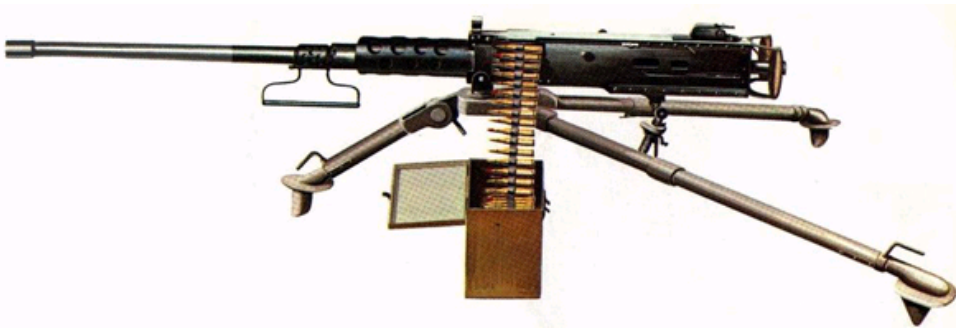
M2HB型12.7毫米重机枪[千龙军事]