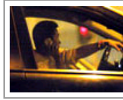
警方惩处视若无睹 周杰继续无证驾驶