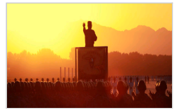
新华军事写给受阅官兵的诗：追随[配图：光与影]