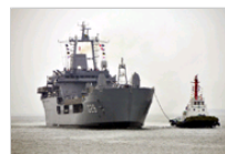
水中武器 巴西“加西亚德阿维拉”号登陆舰组图