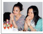
张韶涵首度回应母女反目 明星家丑频曝光