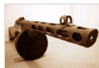
轻武器 战场扫帚 二战中大放异彩的冲锋枪