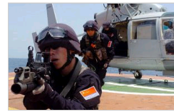
中国海军护航编队反海盗演练[组图]