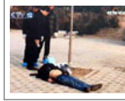
痴男千里寻爱 患病遭同居女友抛弃致死