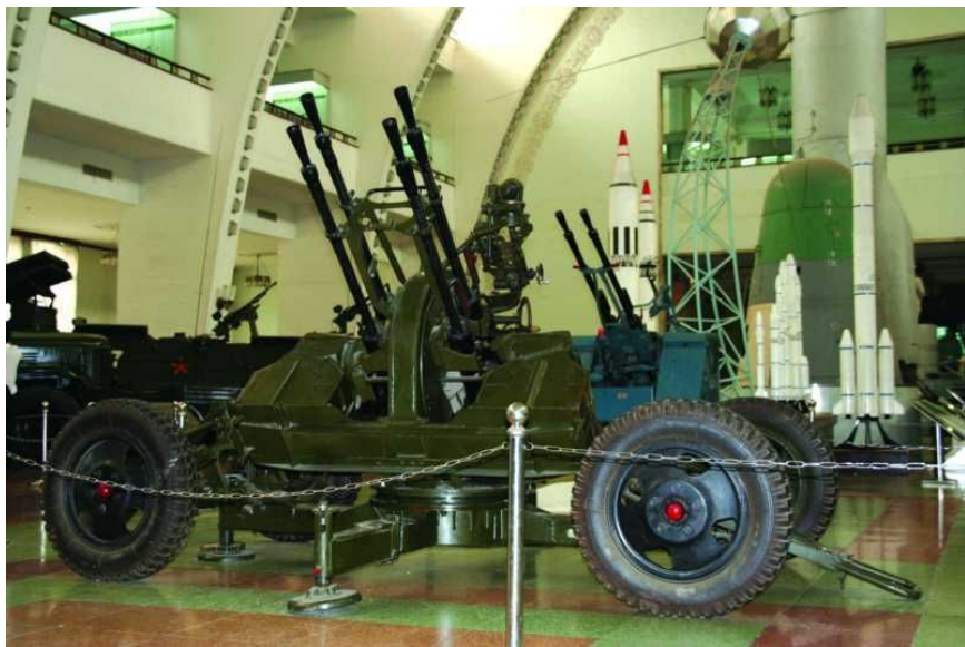
中国人民革命军事博物馆中陈列的56式14.5mm四联高射机枪

56式四联14.5mm高射机枪全枪结构比较复杂，本文在上篇中进行了展示。下篇将为您介绍该枪配用枪弹、主要机构动作、操作使用以及实用战例。