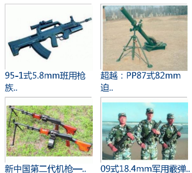
95-1式5.8mm班用枪族.. 超越：PP87式82mm迫.. 新中国第二代机枪一.. 09式18.4mm军用霰弹..