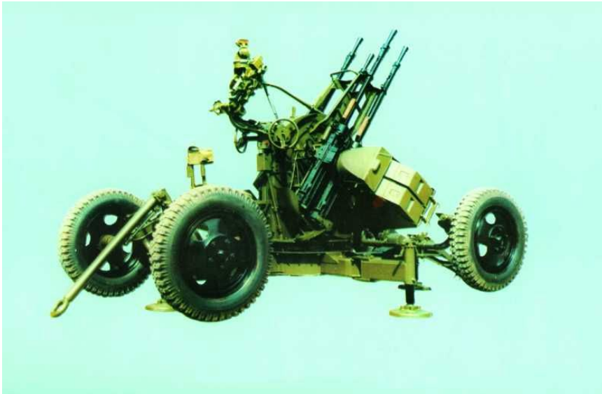
1956年式14.5mm四联高射机枪

国产1956年式14.5mm四联高射机枪、1958年式14.5mm双联高射机枪分别仿自苏联ZPU-4式14.5mm四轮四管高射机枪、ZPU-2式14.5mm两轮双管高射机枪。两种高射机枪枪身相同，只是安装的高射枪架不同。本文为您展示这两种机枪的研制背景、结构性能及战场经历。