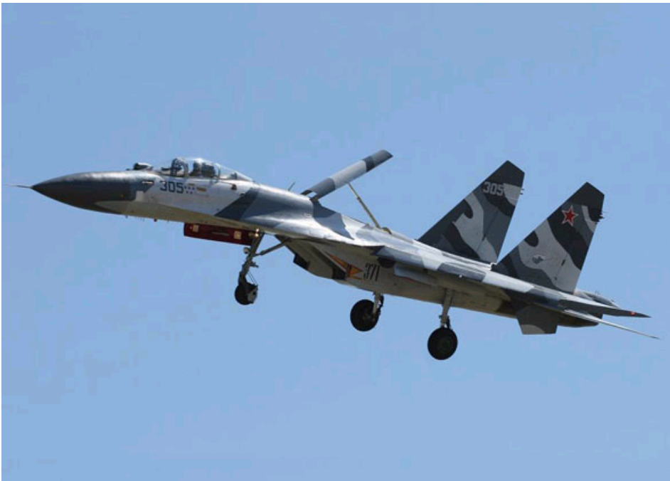
俄罗斯苏-30战斗机 [资料图片]