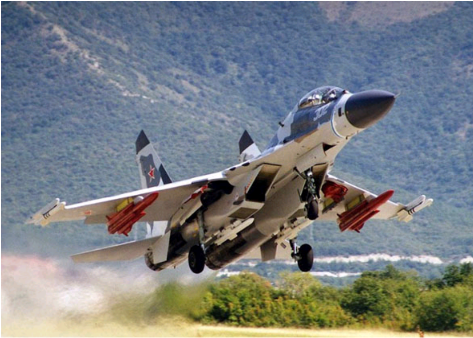
俄罗斯苏-30战斗机

【字号 大 中 小】 【我要打印】 【我要纠错】 【Email 推荐: 提交 】