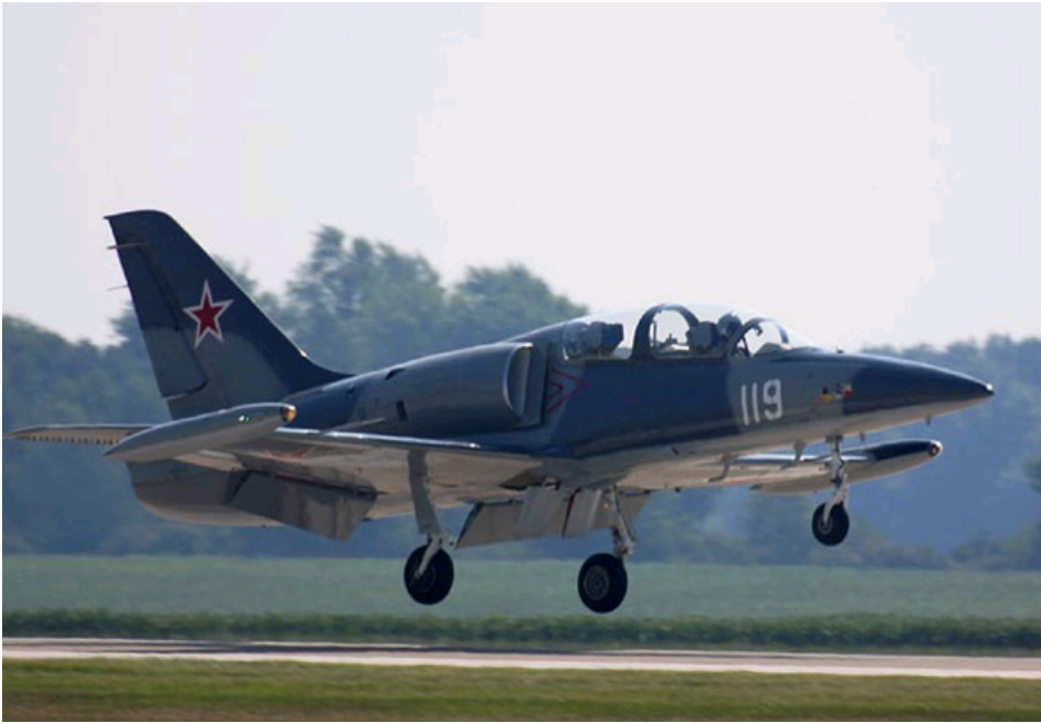
捷克L-39“信天翁”教练机

【字号 大 中 小】 【我要打印】 【我要纠错】 【Email 推荐: 提交 】