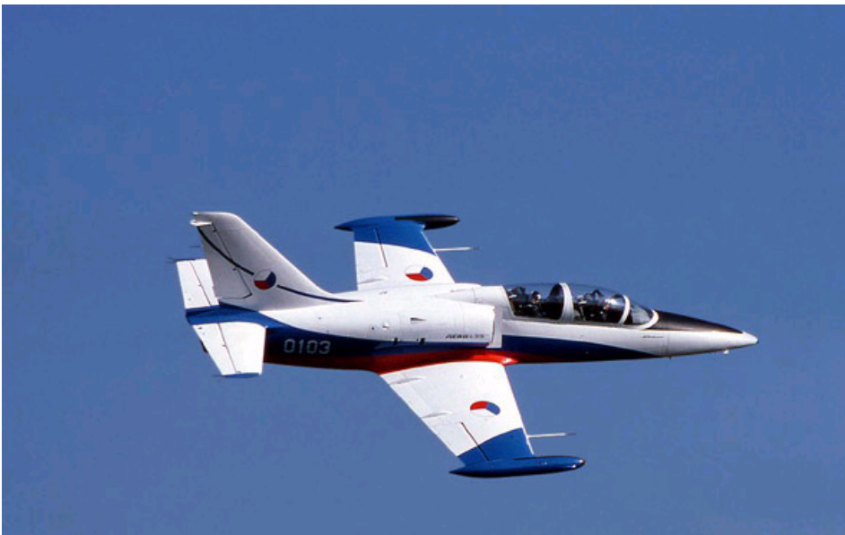
捷克L-39“信天翁”教练机 [资料片]