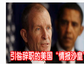
引咎辞职的美国“情报沙皇”