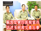
视频:解放军第四医院官兵讲述玉树救灾难忘事