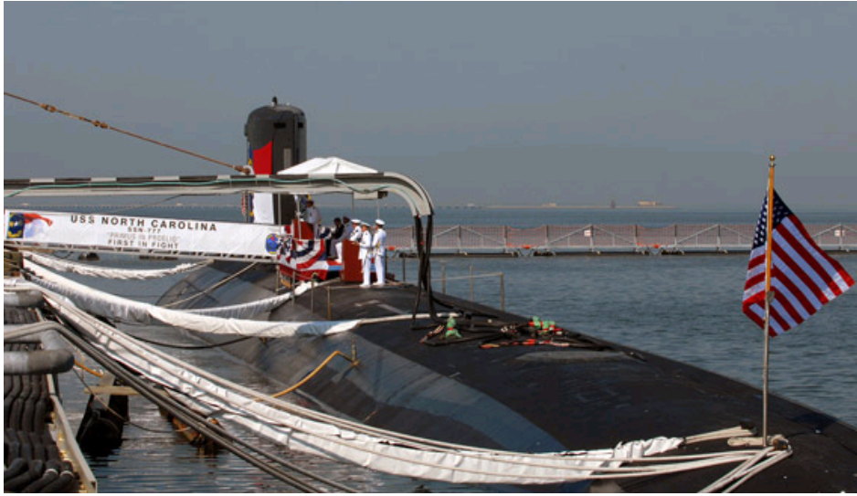
“弗吉尼亚”级“北卡罗来纳”号攻击型核潜艇（SSN777）。

“北卡罗来纳”号潜艇于2004年5月22日铺设龙骨，于2008年5月3日举行服役仪式。