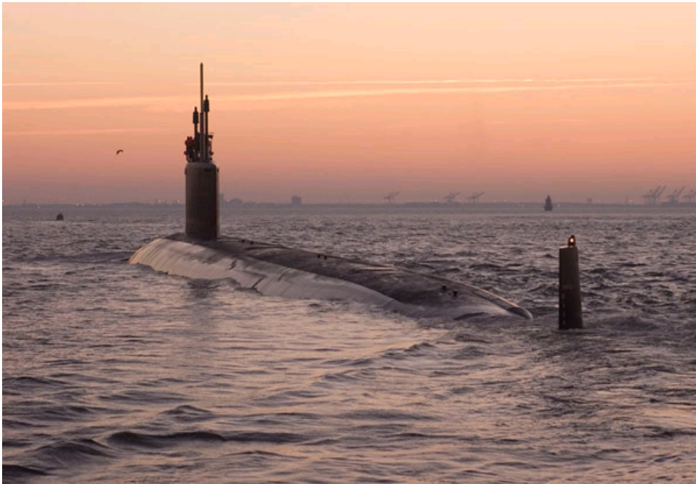
“弗吉尼亚”级“北卡罗来纳”号攻击型核潜艇（SSN777）。

据中国国防科技信息网报道 美国太平洋舰队潜艇部队司令官于1月6日宣布：“北卡罗来纳”号攻击型核潜艇(SSN777)将成为第三艘将珍珠港作为母港的“弗吉尼亚”级潜艇。