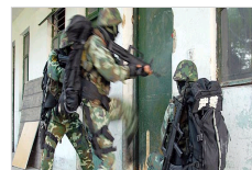
武警淮南支队反恐大练