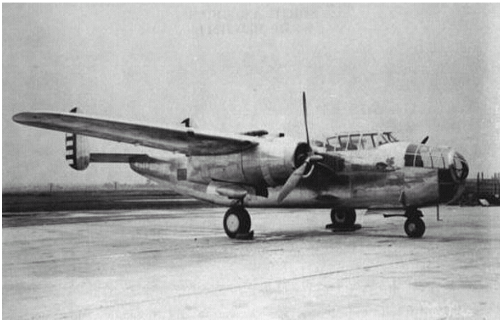
美国B-25“米切尔”轰炸机的原型机NA-40-1轰炸机 [资料图片]