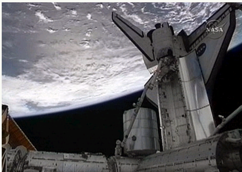
图为国际空间站和“发现”号航天飞机，照片中蓝白色背景为地球。

9月3日，美国国家航空航天局公布的照片显示，“发现”号航天飞机的美国宇航员于格林尼治时间3日晚10时19分(北京时间4日凌晨6时19分)开始第二次太空行走，宇航员将在约6.5小时长的第二次行走中安装冷却空间站的新氨水罐。