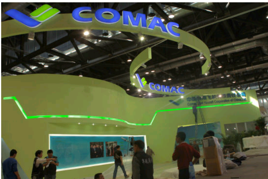
中国商飞展区正在布展。