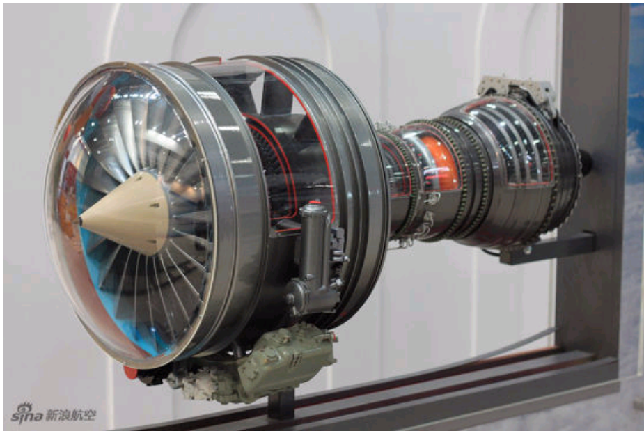
航展现场展出的IAE发动机。

随着国际经济的逐渐回暖，全球航空产业迎来了它新的发展机遇。经过长达一年的准备工作，2011年北京航展于9月21日至24日在国家会议中心举行。中国航空工业集团公司、波音公司、欧洲宇航、空中客车、庞巴迪、美国霍尼韦尔、欧洲直升机公司、阿古斯塔维斯特兰直升机公司、俄罗斯直升机公司、欧洲航材公司、AMECO、埃斯特兰等近200家国内外知名航空企业参展参会。