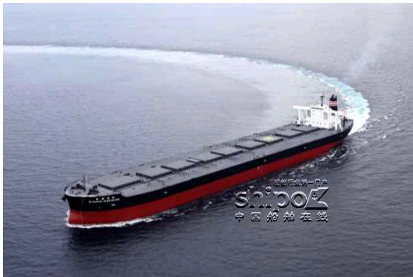
“武钢创新”号矿石船在海上试航

大公报11月3日讯 由武汉钢铁集团与日本邮船合作的一艘25万载重吨矿砂船“武钢创新”号，日前在日本今治船厂交付，未来将由武钢长期租用，在西澳洲至中国航线上承运铁矿石。