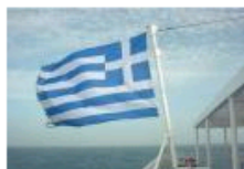
希腊船东“偏爱”中日船厂