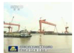
任元林：造船业进入战国时代