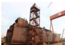
浙江船企：消失多年的大