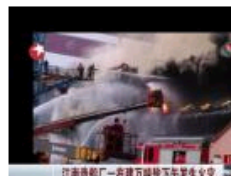
江南造船厂一在建船台下午发生火灾