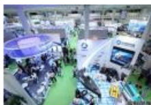
第二届上海国际海洋科技