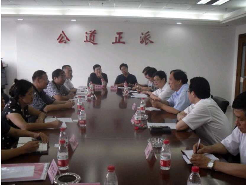
考察组同广州铁路集团相关负责人座谈