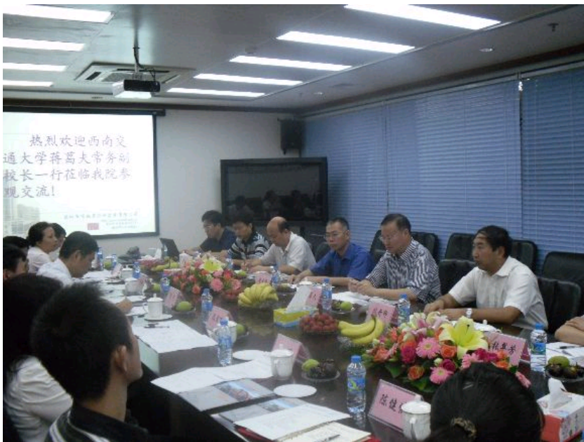
考察组同深圳市政设计研究院相关负责人座谈