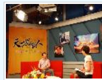
安徽电视台《天下安徽