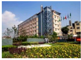
2010年度隧道股份招聘应