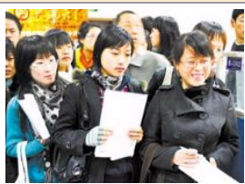
互相转告: 隧道股份2009