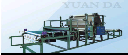
台电MP4与广告美女窒息图赏