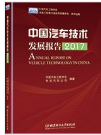
《中国汽车技术发展报告》