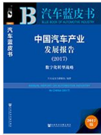
《中国汽车产业发展报告》