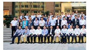
中国汽车工程学会九届一次常 波成功召开