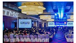
第十届国际汽车变速器及驱动 (TMC2018) 在京盛大开幕