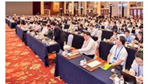
第五届智能网联汽车技术年会 宁波盛大举办