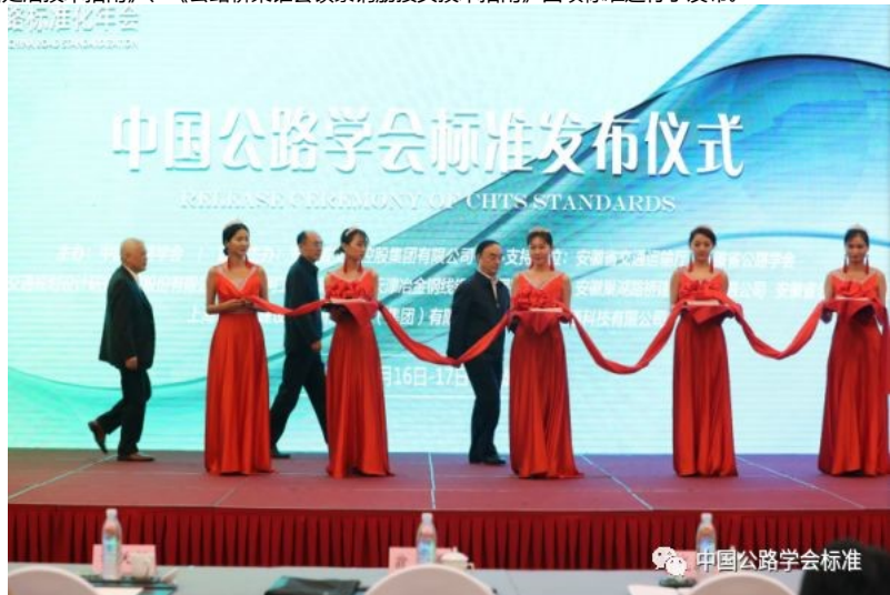
中国公路学会标准发布仪式

同时，还举行了中国公路学会标准发布仪式，对《公路桥梁防船碰撞装置技术指南》、《高速公路广告设施设置技术要求》、《公路路面彩色聚氨酯及其改性环氧树脂表面处治技术指南》、《公路桥梁锥套锁紧钢筋接头技术指南》四项标准进行了发布。