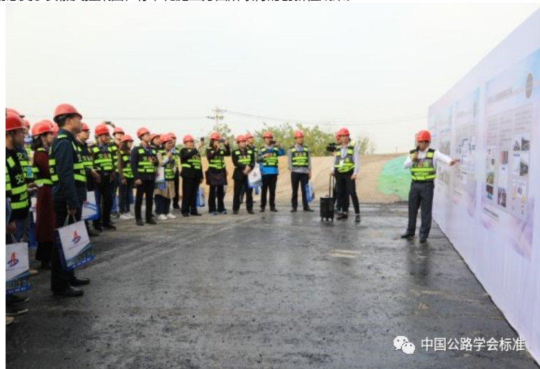
参观安徽交控实体工程

17日下午，与会代表参观了安徽省交通控股集团有限公司合肥至芜湖国家高速公路改扩建工程“免涂装耐候桥、装配式通道、桩板式路基”等三项标准化施工现场，现场感受了安徽交控集团在标准化施工方面所取得的创新性成果。