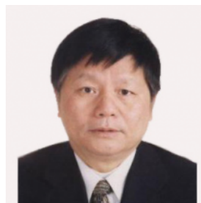
陈政清 中国工程院院士、湖南大学土木工程学院教授、风工程研究中心主任