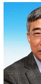
顾祥林 同济大学副校长、木工程学会副理事长