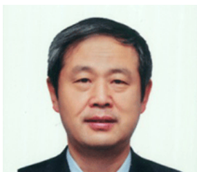
林鸣 中国交通建设股份有限公司总工程师、港珠澳大桥岛隧项目总经理兼总工程师