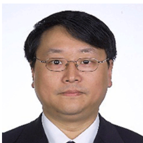
顾伟华 申通地铁集团有限公司总裁、上海市土木工程学会理事长