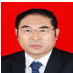
杜彦良 中国工程院院士、石家庄铁道大学教授