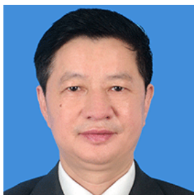
陈湘生 中国工程院院士、深圳市地铁集团有限公司总工程师