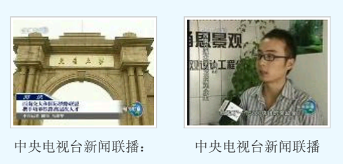
中央电视台新闻联播： 中央电视台新闻联播