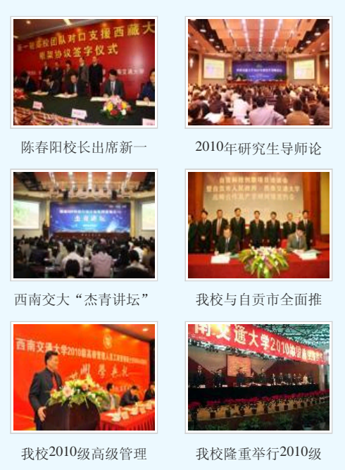
陈春阳校长出席新一 2010年研究生导师论 西南交大“杰青讲坛” 我校与自贡市全面推 我校2010级高级管理 我校隆重举行2010级