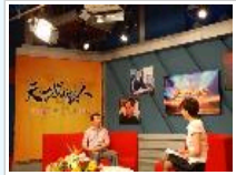
安徽电视台《天下安徽