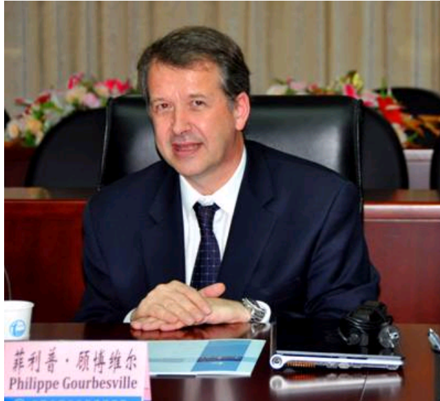
菲利普·顾博维尔校长讲话

菲利普·顾博维尔校长对我院的热情邀请和接待表示感谢。他介绍了法国综合理工大学在水利工程师培养方面的成功经验，以及和中国相关科研机构和合作情况。他对会谈提出的合作设想表示赞同，并在人才培养等方面提出了具体建议。