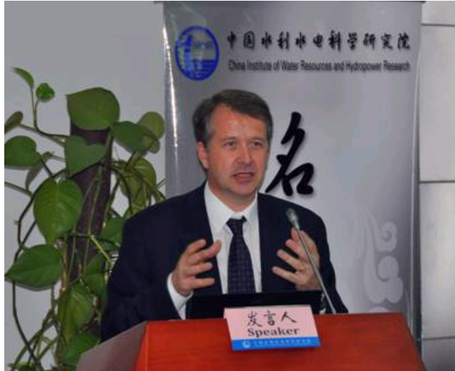
菲利普·顾博维尔校长做客名家讲坛

报告强调了当前流域水资源管理的复杂性，介绍了面向智能河流的流域管理。该方法综合考虑了水循环的三个方面：用户、水资源保护和涉水灾害的防治。他用生动的例子介绍了相关理论基础和解决方案，阐述了“智能水”、“可恢复性”和“风险文化”等新的概念。报告宏观前瞻，引起大家浓厚的兴趣。与会者就关心的问题进行了进一步的讨论和交流。