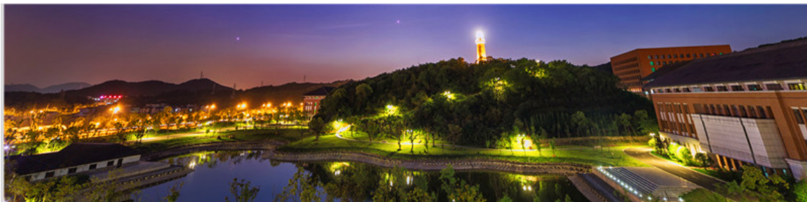
浙江大学舟山校区夜景