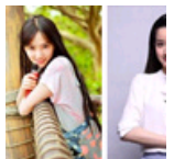
盘点大学绝美校花