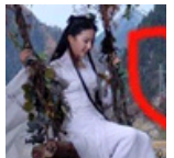
影视搞笑穿帮镜头