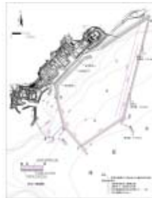
图 5 方案 3、4 取排水工程布置示意