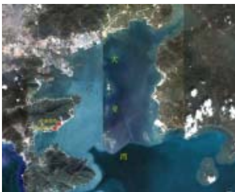
图1 岭澳核电厂址地理位置示意图

早期岭澳二期的温排水问题符合当时的法律、法规，大亚湾核电基地的取排水工程布置经过科学论证。但1998年7月国家颁布实施新的海水水质标准及2000年关于大亚湾水产资源自然保护区功能区划的粤海水[2000]23号文，大幅提高了海域温升的控制标准并设置了保护区范围（见图2），大亚湾核电基地现有的取排水工程布置变得与目前的环保法规的要求不相适宜了。在新的海水水质标准及海洋功能区规划条件下，大亚湾核电基地现有的取排水工程布置就变得与环境要求相悖了，因此，必须对现有的排水布置进行调整，以满足相关法规的要求。