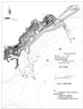
图 4 方案 1、2 取排水工程布置示意

(1) 方案 -底部合取+明渠表排；(2) 方案 -明渠取水+冷却池；(3) 方案 -底部合取 +冷却池；(4) 方案 -底部分取+单导堤；(5) 方案 -明渠取水+800m 管排；(6) 方案 -明渠取水+大冷却池；(7) 方案 -现状明渠排+远排；(8) 方案 -近岸南向排+远排。