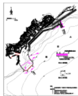
图 8 推荐方案取排水工程布置

排水口布置：采用明渠排放方式，排水明渠轴线与正北向成 155 度角，排水流速为 1.9m/s，排水明渠长度为 300m，宽 24m，明渠底高程为-7.0m。