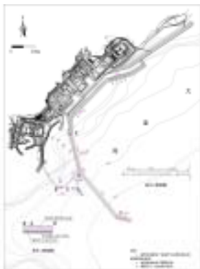
图 6 方案 5 取排水工程布置示意