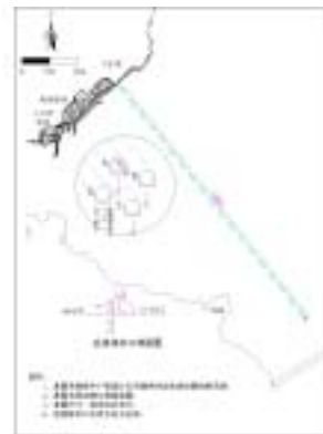
图 7 方案 7、8 取排水工程布置示意