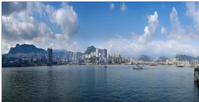
诗画三峡 湖城万州

重庆市万州区是三峡库区最大的移民城市，随着区域中心城市步伐加快，万州区委、区政府把城市管理提升到改善投资环境和发展环境，增强城市综合竞争力的高度，确定了在“十一五”期间创建国家卫生城区、市级文明城区的目标，着力打造具有山水园林特色的区域性中心城市，成为西部最宜居的城市之一。万州城市管理围绕这一目标，开展了以“净化、绿化、美化、亮化”四大工程为载体的综合整治，强化市容环境卫生、环卫设施维护和园林绿化管理，为万州经济社会的持续、快速、健康发展奠定了良好的基础。目前又在成功创建市级卫生城区基础上，立足“七化”，全面推进精细化城市管理，使万州与重庆市第二大城市地位匹配，并且成为中西部城市中城市管理出色的典范--今年4月，万州还与西安、秦皇岛、昆山、济南、芜湖等19座城市一起，上榜“中国最佳管理城市”。